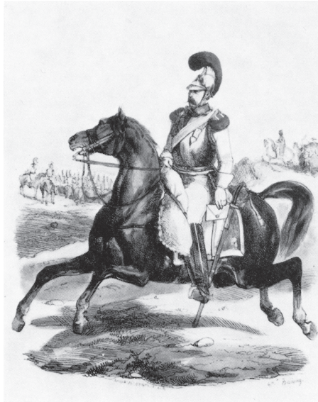
Een carabinier à cheval, zoals Joseph Abbeel. (Lithografie, anoniem, 1811)

landsjongens als Abbeel. Zijn oude handschrift verbaast dan ook. Het is sierlijk gekruld en vertoont slechts af en toe de krommige hanenpoten die je van een eenvoudige mens uit die tijd zou verwachten. Een intellectueel zou ik Abbeel niet durven te noemen, maar wel een intelligente, gevoelige man die nauwkeurig observeerde, een verbluffend inzicht had en ook enigszins belezen was. Niet het clichébeeld van de primitieve grombaard uit de Grande Armée dus.