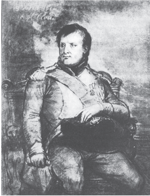
Schets van Napoleon in Saint-Cloud op 13 april 1812. (Potloodtekening door Anne-Louis Girodet, 1812, Musée Bertrand, Chateauroux)

bouweconomie was gebaseerd op lijfeigenschap en veertig procent van al die slaven waren het rechtstreekse bezit van de tsaar zelf. Wat Sint-Petersburg veel meer zorgen baarde, was dat het machtsevenwicht in Europa in het nadeel van Rusland was verschoven. Het Franse keizerrijk omvatte de Nederlanden en breidde zich uit tot de Rijn, Napoleon was in Italië verkozen tot koning en kreeg vat op de Middellandse Zee, de Balkan, de haven van Constantinopel. Dat waren essentiële pionnen op het Russische schaakbord. Het kwam tot een eerste militaire confrontatie in 1805, die op een ramp uitdraaide voor de tsaar. In Austerlitz versloeg Napoleon op werkelijk verpletterende wijze in één klap de Oostenrijkse en Russische legers. Het gevolg was dat de Franse legers nu diep in Pruisen stonden, dat Oostenrijk bijna bankroet was en dat de Russen terug naar af moes-