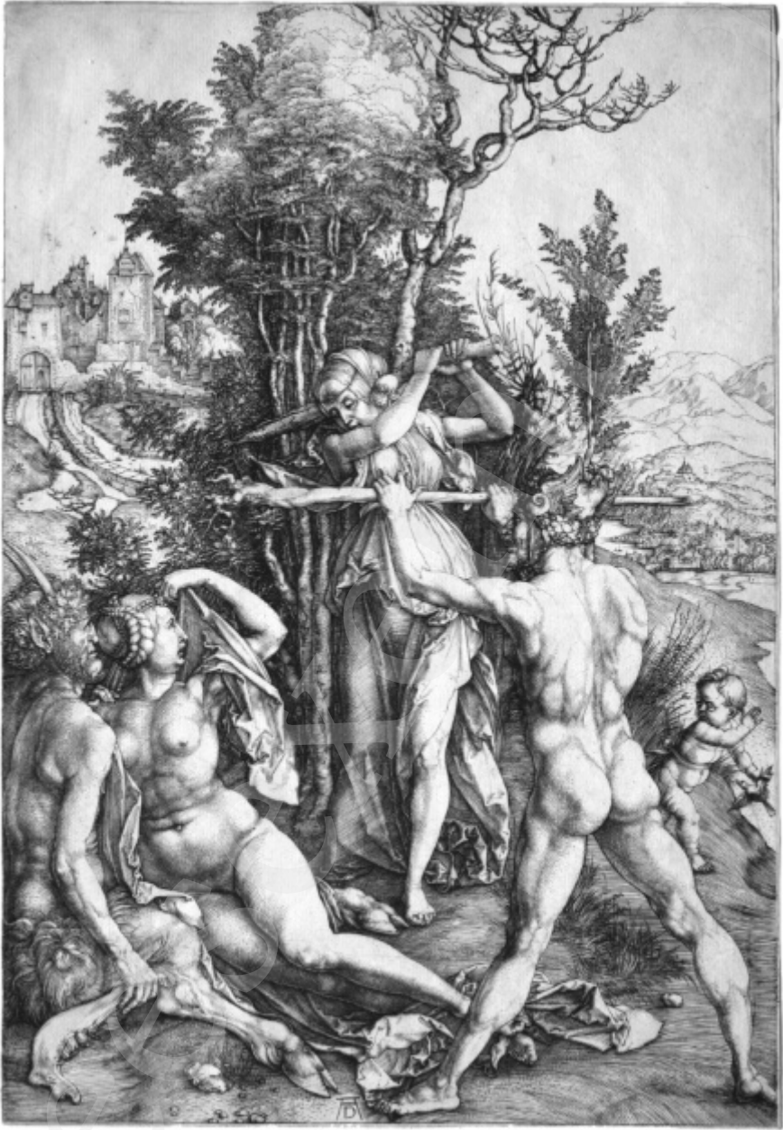
Hercules op de tweesprong. (Albrecht Dürer, 1498)