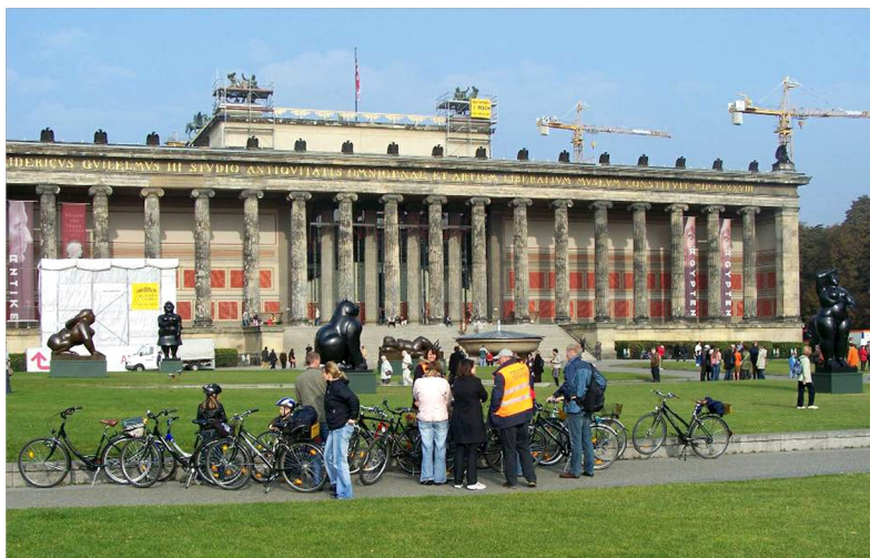
Altes Museum aan het Schloßplatz

Deze gids is geschreven als aanvulling op de standaard-reisgidsen. Grote toeristische attracties zullen niet of alleen kort worden genoemd. Neem dus zelf een goede reisgids mee en ook een plattegrond van de stad. In de routebeschrijvingen is vooral aandacht voor zaken die in de meeste reisgidsen niet aan bod komen.