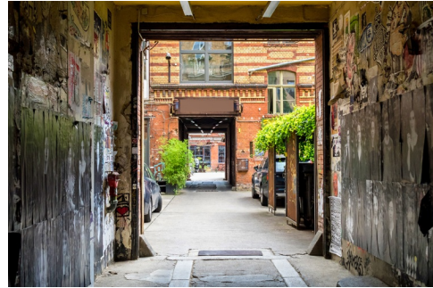
De karakteristieke Hinterhöfe van Berlijn.

Alle panden staan los van elkaar om te voorkomen dat bij brand hele blokken tegelijk afbranden. Daardoor gebeurde het in de Tweede Wereldoorlog regelmatig dat het ene huis kapot gebombardeerd werd, terwijl het buurhuis ongeschonden rechtop bleef staan.