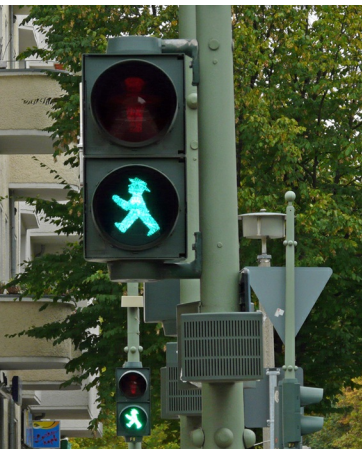
Ampelmännchen, een laatste herinnering aan de DDR.

Even onverwacht als hij is gekomen, verdwijnt de onneembare barrière tussen Oost en West-Berlijn op de late avond van 9 november 1989. Bij de grensovergang Bornholmer Straße gaat een slagboom omhoog en een grote groep mensen loopt de grens over. Een jaar later, op 3 oktober 1990, is er weer één verenigd Duitsland.