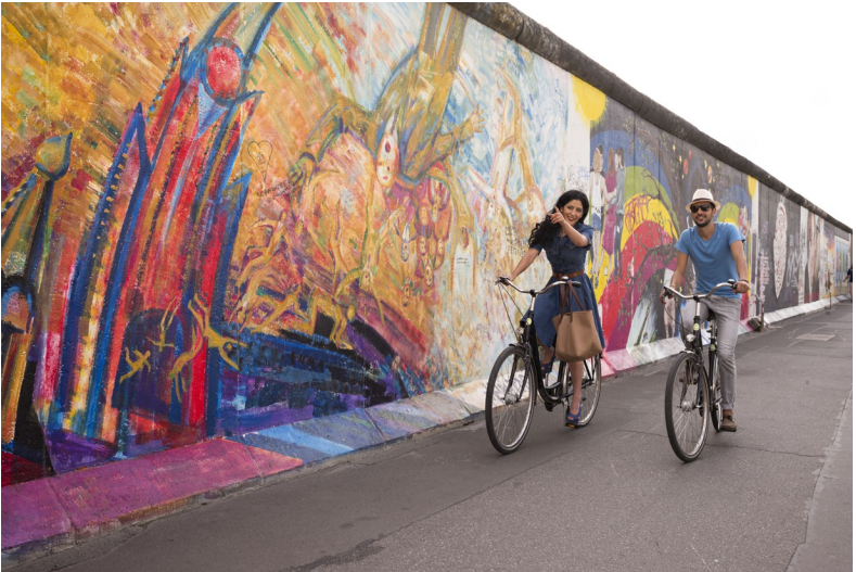
Fietsen langs de Berlijnse Muur.

Rond 1230 ontstaan aan weerszijden van de rivier de Spree twee dorpjes: Berlin en Cölln. In de 17de eeuw groeien ze samen uit tot de stad Berlijn, die in 1871 de hoofdstad wordt van het net gestichte Duitse Rijk. Onder invloed van de industriële revolutie trekken er zoveel mensen naar Berlijn dat de stad uit haar voegen barst. In de jaren 1920 wonen er al vier miljoen mensen. In de roaring Twenties wordt Berlijn wereldwijd bekend vanwege haar nachtleven, jazzclubs en absolute vrijheid op bijna alle vlakken. Daar maakte Hitler begin jaren 1930 hardhandig een einde aan.