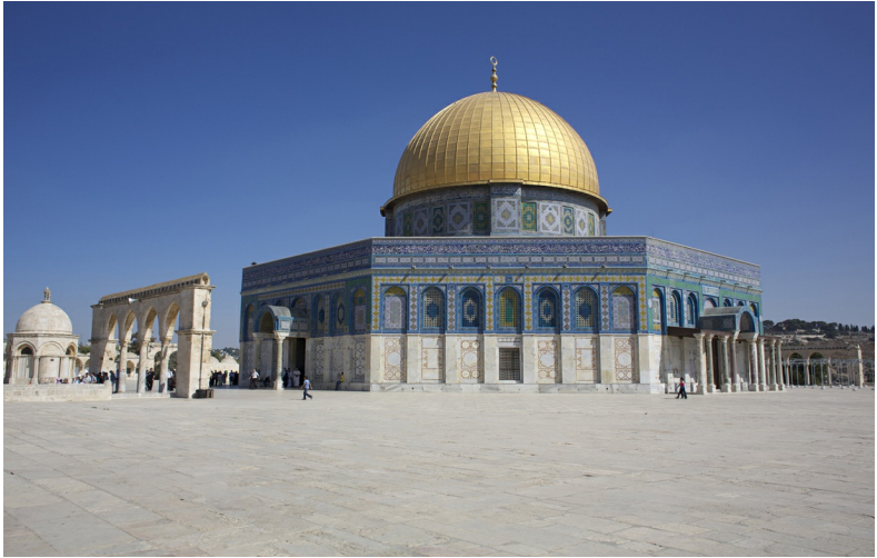
De Kettingkoepel (links) en de Rotskoepel op de Tempelberg

Godsdienst kent heel veel gezichten. Enerzijds is het een krachtige bron van inspiratie terwijl het anderzijds vaak heeft aangezet tot geweld en onverdraagzaamheid. Beide kanten van het geloof vind je bij uitstek terug in Jeruzalem. De stad bezielt miljarden aanhangers van het jodendom, christendom en de islam. In deze gids gaat het dan ook voornamelijk over de plekken die samenhangen met de drie grote monotheïstische godsdiensten. Daarbij schuwen we een uitgebreide blik op de geschiedenis niet maar kijken we ook naar de dagelijkse werkelijkheid van het leven in Jeruzalem in het bijzonder en Israël in het algemeen. Het zijn dus die religies die Jeruzalem uniek maken. Maar... er is natuurlijk meer. Veel meer.