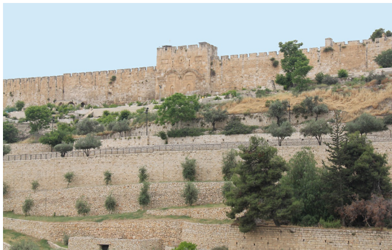
Stadsmuren rond de Tempelberg met de dichtgemetselde Gouden poort

Sultan Suleiman de Grote bouwde na 1517 de huidige stadsmuren die op tal van plaatsen werden versterkt met torens en poorten. Deze stadsmuren lenen zich uitstekend voor een heerlijke wandeling en eerste verkenning van de Oude Stad. Je kunt vanaf de Jaffapoort de Ramparts walk (za- do 9-16 uur, vr 9-14 uur, ILS 12-20) maken. Het is om veiligheidsredenen niet mogelijk de volledige tocht over de muren te maken. Kaartjes kun je kopen bij het informatiecentrum bij de Jaffapoort. Advies: neem de route van de Jaffapoort naar de Leeuwenpoort. De wandeling van de Jaffapoort naar de Mestpoort is minder indrukwekkend en veel korter. De Oude Stad heeft dus een stadsmuur waarin acht poorten zijn aangebracht waarvan er zeven een toegang vormen tot deze zo bijzondere plek. Binnen de muren is de stad verdeeld in vier wijken: in het noordwesten de christelijke wijk, in het noordoosten de moslimwijk, in het zuiden de Armeense wijk en in het zuidoosten de na 1967 herbouwde Joodse wijk. Die wijken worden hieronder besproken.