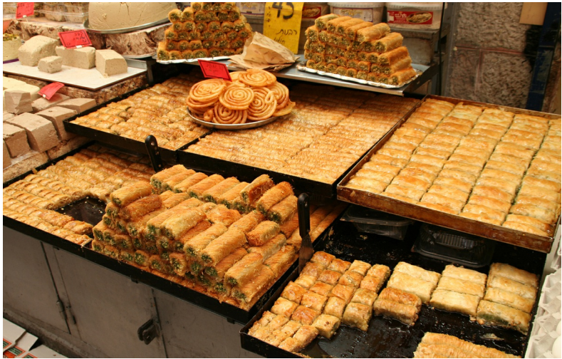
Zoete lekkernijen in de moslimwijk van de Oude Stad

Zonder twijfel is de moslimwijk de aantrekkelijkste wijk van Jeruzalem. De wijk bestaat uit een wirwar van straten, zijstraatjes en stegen. Een deel van die straten wordt overdekt door bogen en gewelven. De twee hoofdstraten die de scheidingslijn vormen van de christelijke en de Joodse wijk, zijn respectievelijk de Khan es-Zeit Straat en de Ha Shalsholet Straat. De eerste verbindt de Damascuspoort met het hart van de stad. Je vindt hier voornamelijk winkeltjes. De kooplieden bieden groenten, fruit, meel, broodjes met sesamzaad en nog veel meer aan. Daarnaast vind je er ook kleding, aardewerk, lederwaren, sieraden en antiek (of zaken die op antiek lijken). In de werkplaatsjes zijn slaggers, kleermakers, smeden, bakkers, schoenmakers en koperslaggers bezig. Veel mannen en vrouwen lopen er doorgaans nog in traditionele kleding: vrouwen met lange rok en hoofddoek en mannen in de keffijah, die door een zwart koord van kameel- of geitenhaar wordt vastgehouden. De bezoeker moet oppassen niet te worden 'aangereden' door een van de zwaarbeladen ezeltjes en mannen met hoog opgestapelde karren met goederen. Kopers en verkopers vullen de straten en soms is er geen doorkomen aan. Toch is een bezoek aan de moslimwijk van harte aan te bevelen.