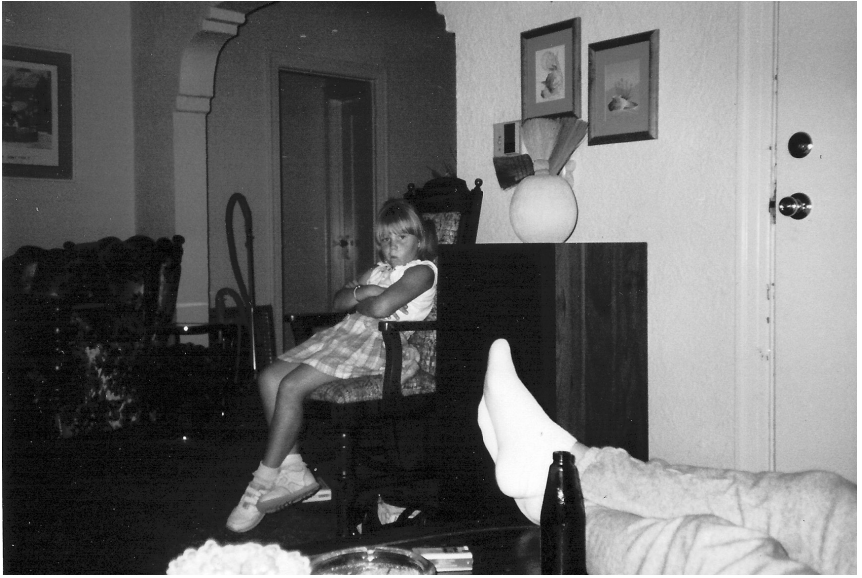
Ik ben acht jaar oud en boos