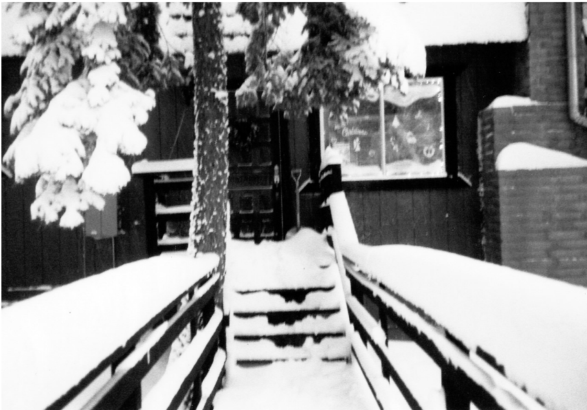
Het huis in Tahoe in de winter

Op een dag, toen ik van Lampson Elementary, waar ik in de vierde zat, naar huis liep, kwam er een auto vol jongens aan die naar me begonnen te schreeuwen en gebaarden dat ik naar hen toe moest komen. Ik begon te rennen en verstopte me achter een struik totdat de auto weer weg was, en daarna rende ik zo snel als ik kon naar huis en deed daar de deur achter me op slot. Soms haalde mijn moeder of Carl me op van school. Dat vond ik fijn. Tahoe is heel anders dan Anaheim. Hier kan ik overal op mijn fiets naartoe, en ik ben hier niet bang.