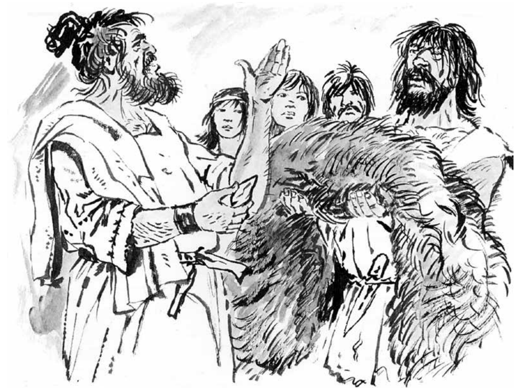
'Ik wil de vuursteen ruilen voor de huid van een os.'

De volgende morgen is de wind gaan liggen. De handelaar moet naar het zuiden, door het moeras. Die tocht zal voor hem niet zonder gevaar zijn. Hij loopt over de pas aangelegde weg, die gemaakt is van naast elkaar gelegde boomstammen, met daaroverheen heiplagen. Toch blijft het moeilijk lopen. De handelaar komt slechts langzaam vooruit. Het is in het moeras wel griezelig. Op sommige plekken groeien bomen, op andere plaatsen is veenmos, waarin je zomaar kunt wegzakken. Huizen hier misschien geesten die je naar beneden trekken? Soms klinken er schrille kreten. Zouden de boze geesten dat doen?