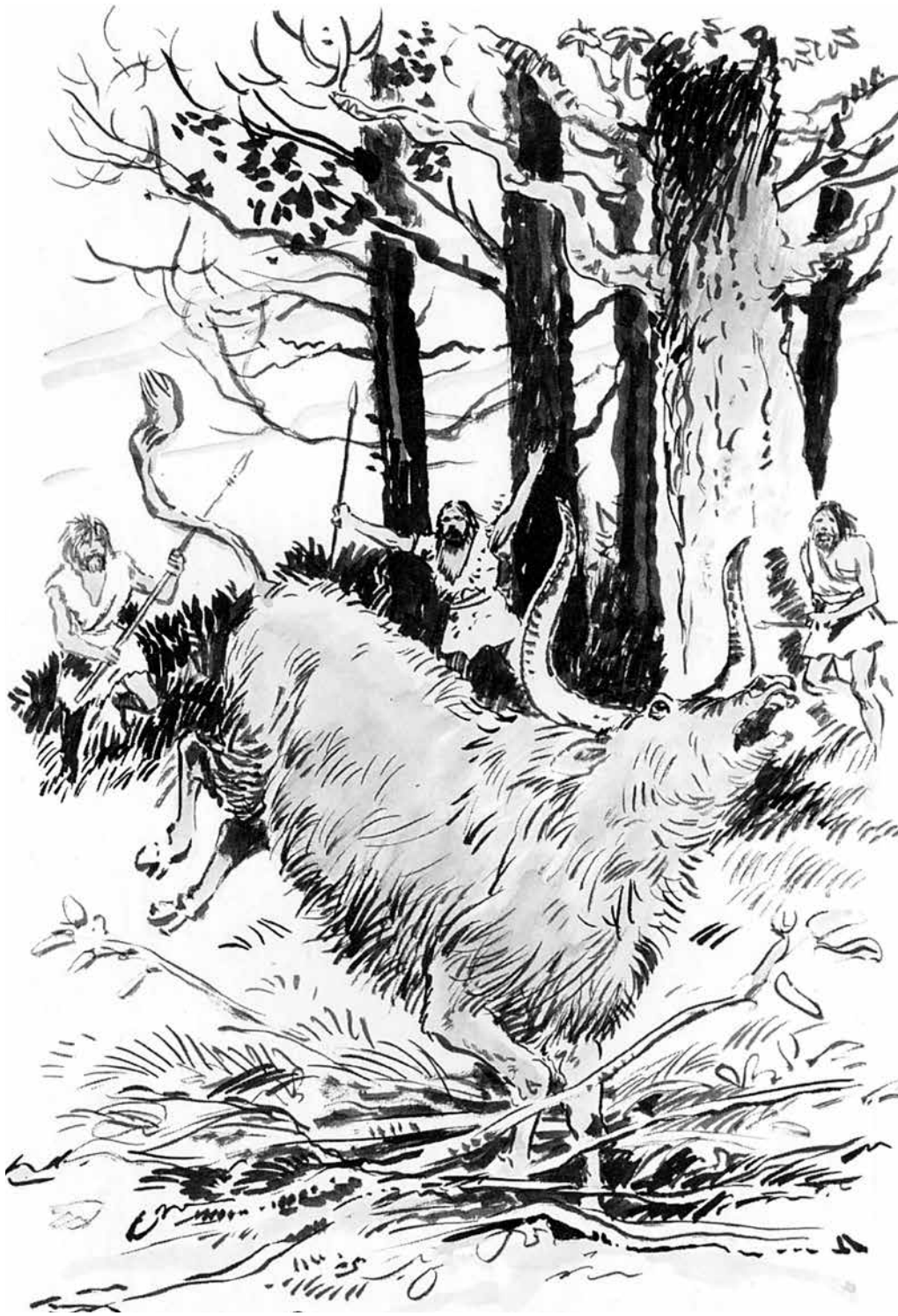
Plotseling brult het grote beest.

De in de grond gestoken speren op de bodem van de valkuil zitten nog vol bloed en haren. Later zullen ze terugkomen om de kuil te herstellen en de bedekking bovenop weer in orde te maken. Een paar kinderen komen de jagers al tegemoet springen. 'Vader, is er weer vlees?' vraagt er één. 'Ja hoor, we hebben een os.'