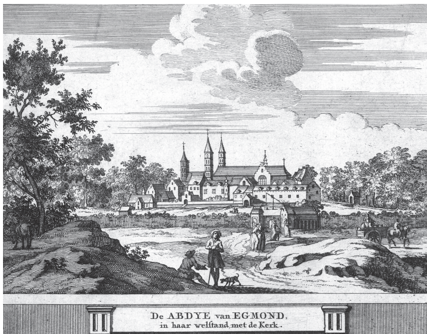
De abdij van Egmond in de zestiende eeuw.

de hulp van Hendrik II kon Dirk III zijn gezag als graaf daadwerkelijk gaan uitoefenen. De Friezen betaalden voortaan belasting en ze waren hem niet meer tot last.