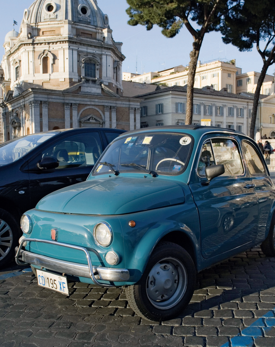
Het authentieke Rome en een typische Fiat 500, Italiaanser kan niet!