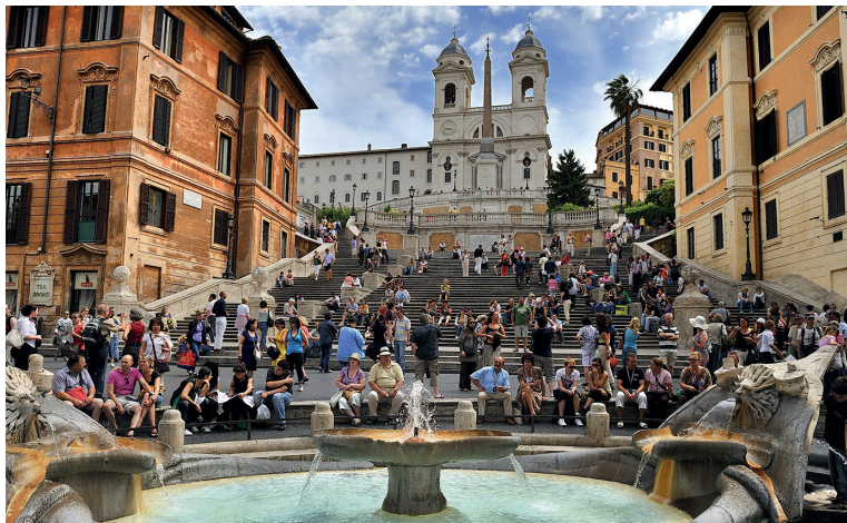
De Piazza di Spagna en de Fontana della Barcaccia, aan de voet van de trappen van de Trinità dei Monti

De ochtend van de tweede dag staat in het teken van kunst en shoppen rond de Piazza di Spagna ★★★ (blz. 67) met een verplichte halte in het Caffè Greco (blz. 120). Trek dan naar de Piazza del