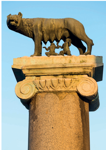
Campidoglio, de wolven en de tweeling Romulus en Remus, stichters van Rome