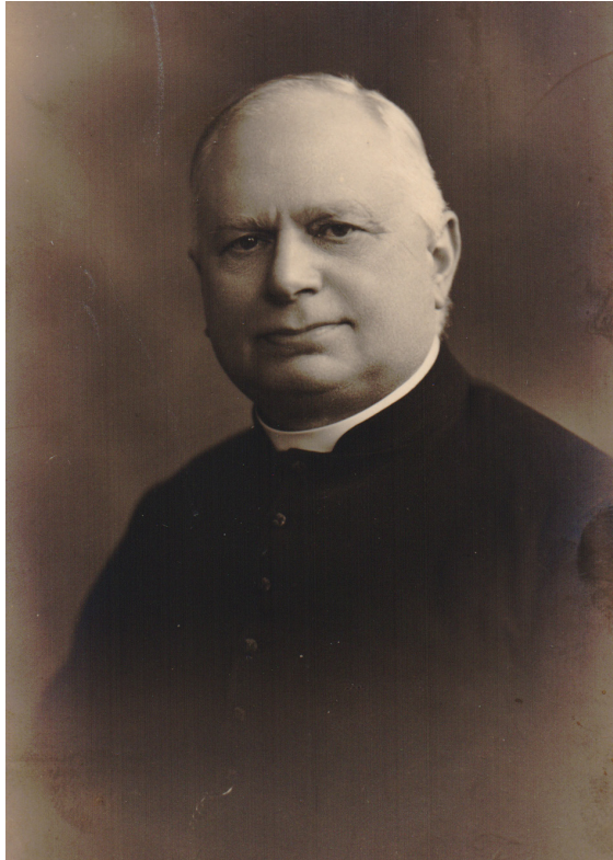
Een oudere Achiel Van Walleghem.