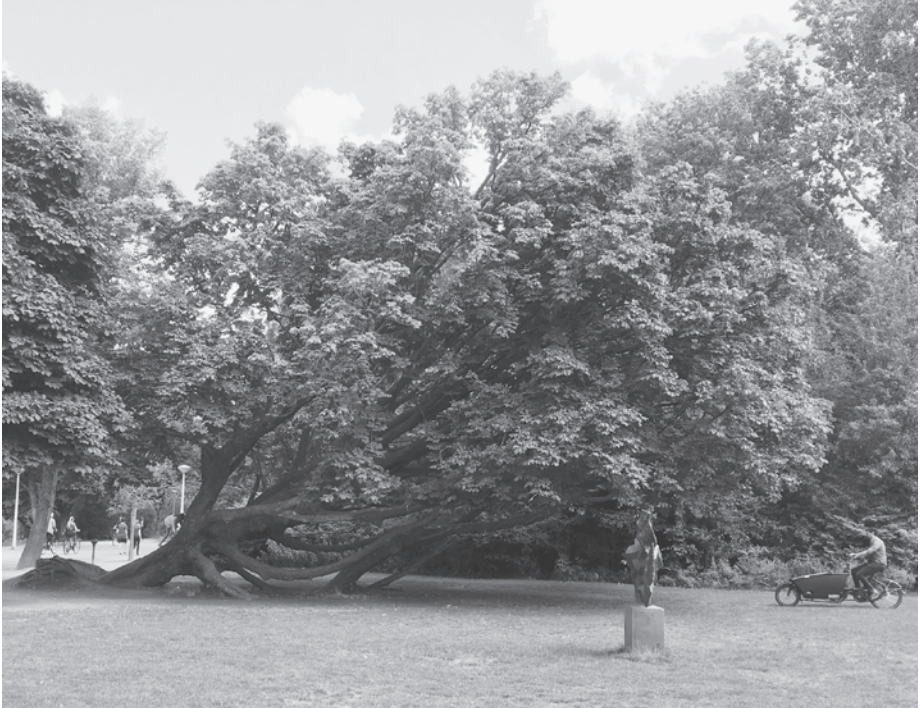
De omgevallen kastanjeboom

dienstdoet als klimrek. Ondanks de getoonde veerkracht heeft het parkbeheer inmiddels maatregelen genomen om vergelijkbare valpartijen in de toekomst te voorkomen.