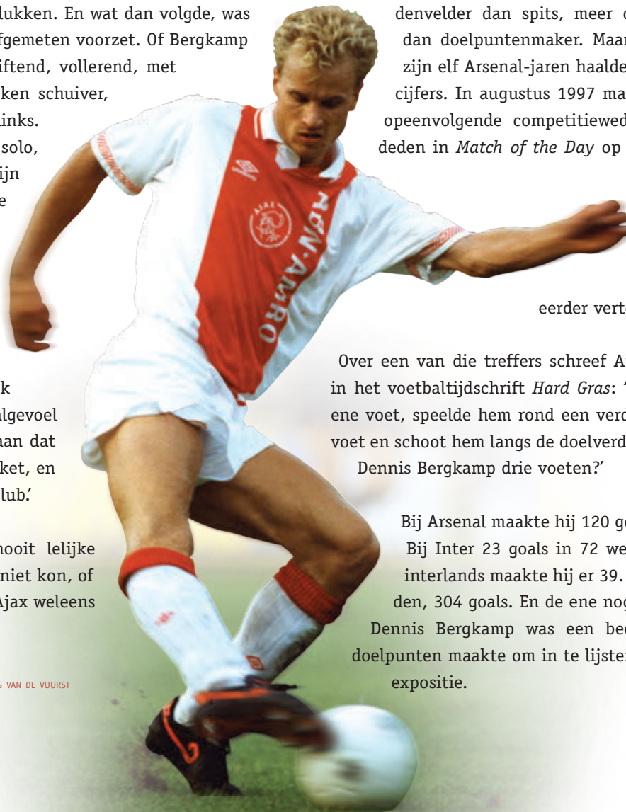
▶ Dennis Bergkamp 1993

Bij Arsenal maakte hij 120 goals in 423 wedstrijden. Bij Inter 23 goals in 72 wedstrijden en in zijn 79 interlands maakte hij er 39. Opgeteld: 811 wedstrijden, 304 goals. En de ene nog fraaiër dan de andere. Dennis Bergkamp was een beeldend kunstenaar die doelpunten maakte om in te lijsten. Een kleine, spontane expositie.