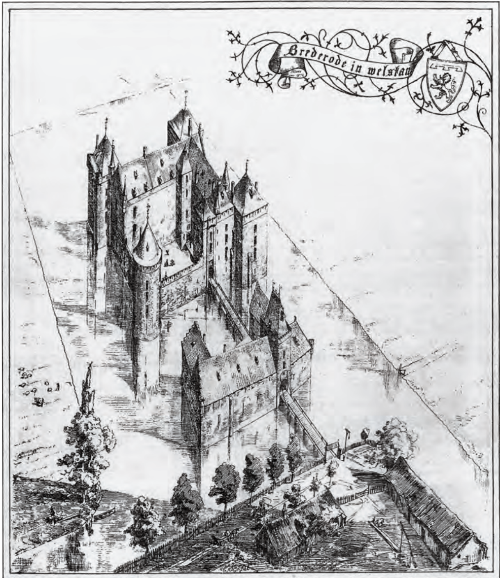
Kasteel Brederode naar een impressie uit 1879