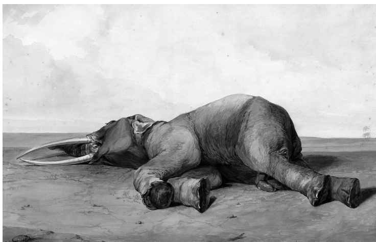
Olifant Jack dood, geschilderd door Conradijn Cunaeus.