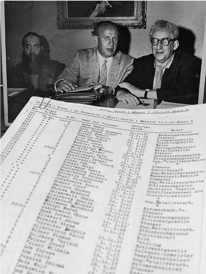
Een originele afdruk van de Schindlerlijst, gevonden in 1999 op de zolder van een huis in Hildesheim, voor een foto van Oskar Schindler (midden)