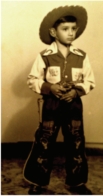
Mijn kerstcadeaus, januari 1956: een cowboypak... en mijn eerste pistool!