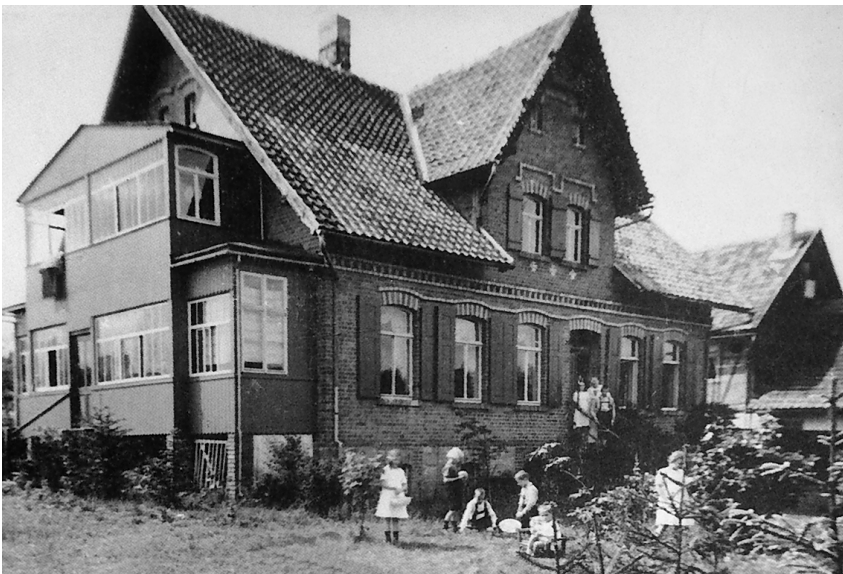
Het vakantiehuis Friedrichsbrunn in de Harz.