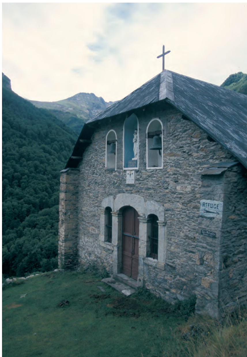
Chapelle de l'Isard