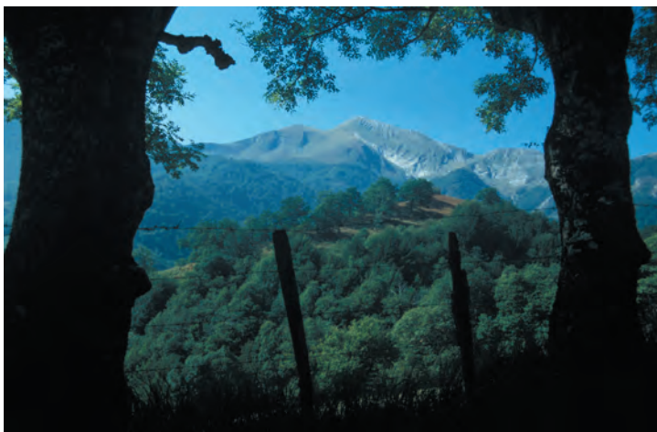
Uitzicht op de Pic d'Orhy

schijnlijk moeten lachen om de vogelaars en gaan intussen onbelemmerd hun gang. Op de eerste dag passeer je de Col d'Orgambideska. Mocht het mooi weer zijn, dan is het zeker de moeite waard er een kijkje te nemen. Vanwege de jacht is het verstandig niet in het najaar aan de tocht te beginnen.