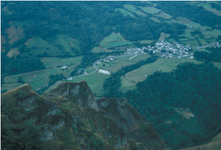
Uitzicht op Larrau tijdens de tweede etappe

de juiste richting af en toe de nodige hoofdbreken kosten. De derde dag is in alle opzichten eenvoudig.