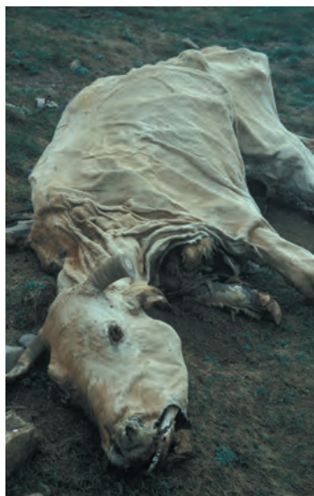
Vel over been

Logibar is niet een dorp of een gehucht maar enkel een huis, 2,5 kilometer ten oosten van Larrau. Behalve bar/restaurant met terras is er ook een gite d'étape. Mogelijkheid om je eigen maaltijd te bereiden. 30 slaapplekken.