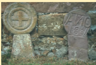
Twee stèles discoidales

Op het kerkhof van vrijwel ieder Baskisch dorpje zie je er wel een aantal van: de typische ronde grafstenen, de zogeheten stèles discoidales, waarvan er nogal wat uit de Middeleeuwen stammen, al schijnt het zo te zijn dat ze al voor onze jaartelling bestonden. De ronde grafsteen staat voor de eeuwigheid, het meestal vierkante, trapezevormige of rechthoekige voetstuk symboliseert het aardse bestaan. Aldus zou de overgang van het aardse naar de eeuwigheid, het hemelse, kunnen worden aangeduid. In het kerkhof bij de 12e-eeuwse kerk van het gehucht Sainte-Engrace (Haute-Soule) vind je mooie exemplaren van middeleeuwse grafstenen. Ze zijn te vinden naast de ingang van de kerk.