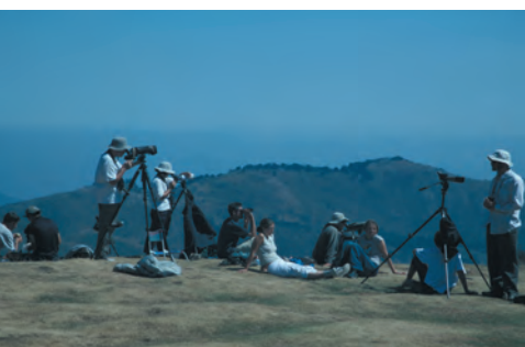
Vogelaars op de Col d'Orgambideska

Tel. en fax 05 59 28 61 14. Reserveren wenselijk. Overdag is het in de regel erg druk bij Logibar vanwege de vele toeristen die naar de hangbrug van Holzarté willen gaan.