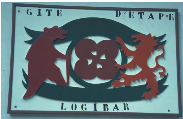
Bordje op gîte d'étape de Logibar

1.45u smalle verharde weg (1165m). Je slaat rechtsaf en volgt de vrijwel vlakke weg gedurende tien minuten tot deze een scherpe bocht naar rechts maakt. Je verlaat de weg, slaat linksaf en volgt een onver-