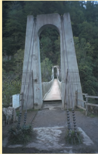
Gespannen boven de Gorges d'Olhadubi: de Passerelle d'Holzarté

Het gesteente in de Haute-Soule is voornamelijk kalk. De grote hoeveelheden neerslag die er jaarlijks vallen (we hebben het hier over het vochtigste gebied van de Pyreneeën) hebben in de loop der eeuwen een aantal kloven in het kalk uitgesleten. Deze kloven, gorges in het Frans, zijn de publiekstrekkers van de regio. Befaamd is de Kakouetta-kloof, die enkel tegen betaling toegankelijk is, vrij onbekend is de Gorges d'Éhujarré die helemaal kan worden doorlopen, en de gorges van Olhadubi en Holzarté genieten grote populariteit vanwege de zogeheten Passerelle d'Holzarté (zie foto), een oude hangbrug boven de Olhadubi-kloof nabij de plaats waar beide gorges bij elkaar komen. Een mooie wandeling van nog geen uur is nodig om bij de wiebelbrug uit te komen. Natuurlijk is deze brug in de tocht opgenomen. Op de derde dag ga je vanuit Logibar naar de brug, die ervoor zorgt dat deze charmante tocht een spectaculair einde krijgt.