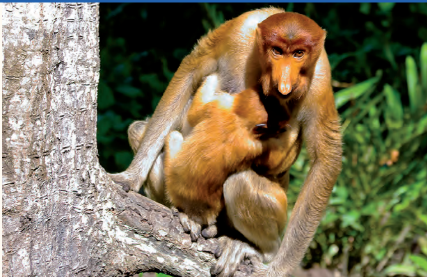
Neusaap met jong

of waarschijnlijk nooit te zien. In sommige gevallen maar goed ook. Een tijger ziet er geen been in om mensen te verorberen en een wilde olifant lijkt in geen enkel opzicht op de goedaardige lobbies die wij in de dierentuin of het circus een suikerklontje voeren.