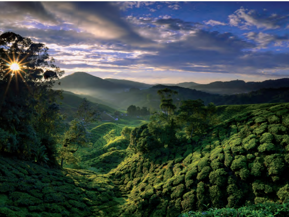
Mooi uitzicht op een theeplantage in de vroege ochtend, Cameron Highlands

Voor een deel is de oorspronkelijke vegetatie van West-Maleisië gekapt en vervangen door oliepalmen en rubberbomen. Veel van de wouden die de heuvels nog steeds bedekken zijn gebruiksbossen geworden, waar houtkapbedrijven om de zoveel tijd in beperkte mate mogen kappen, en moeten er dan weer zo'n jaar of dertig wegblijven. De nationale parken zijn de plaatsen waar de vegetatie nog min of meer in haar oorspronkelijke staat te bewonderen is. Het bekendste park is Taman Negara. Kaarsrechte bomen met enorme afmetingen groeien in de rich-