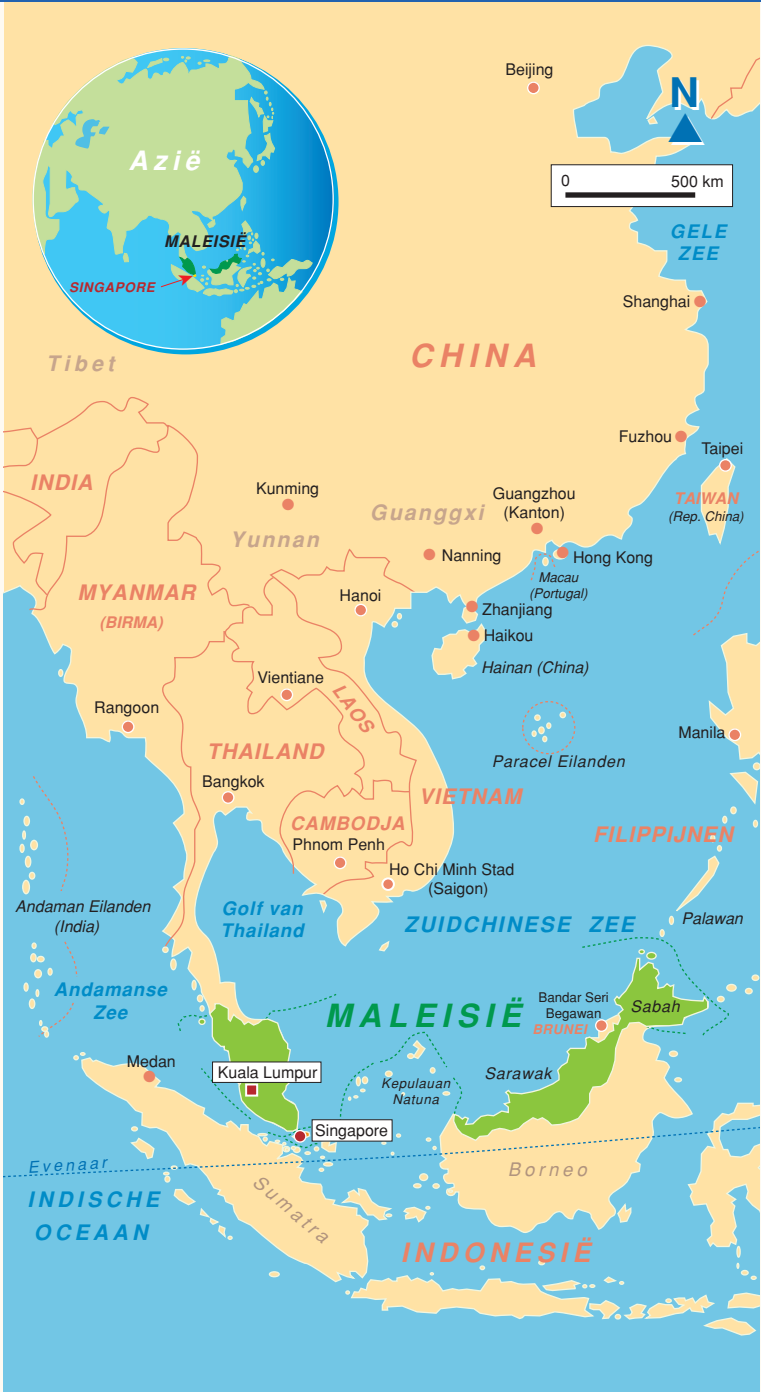
LIGGING MALEISIË EN SINGAPORE IN AZIË