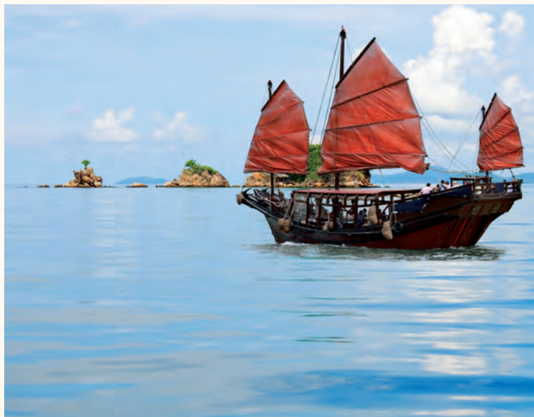
Traditionele Chinese jonk