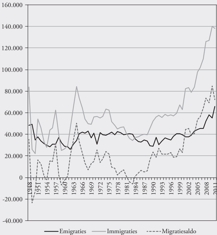
Figuur 1. Evolutie van het aantal immigraties en emigraties van vreemdelingen in België, 1948-2011.

(Uit: Centrum, Jaarverslag Migratie 2012, p. 20. Bron: Rijksregister-ADSEI)