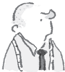
VOOR DE BEHANDELING

Vroeger had hij wel eens reclame gemaakt met zijn eigen haarbos. Hij maakte een foto van zijn prachtige kuif en zette erbij: NA DE BEHANDELING. Daarna schoor hij zijn hoofd kaal, maakte weer een foto en zette erbij: VOOR DE BEHANDELING. Het was bedrog, maar dat kon hem niet veel schelen. Als hij zijn mid-deltjes maar verkocht.