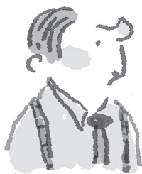
NA DE BEHANDELING

Nu keek hij naar een magisch flesje. Een wonder-middel dat hem beroemd kon maken. Misschien kreeg hij er wel de Nobelprijs voor.