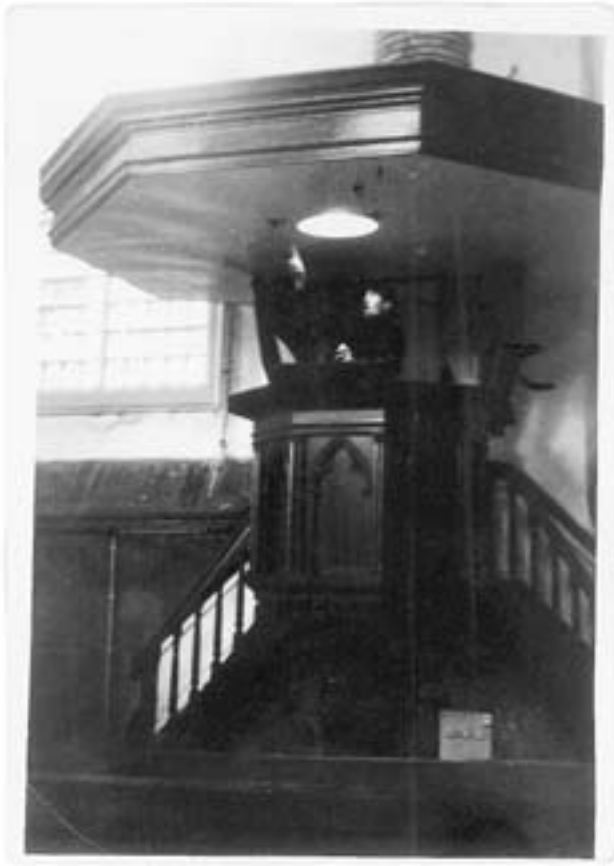
De auteur op de kansel, Broederkerk Kampen, begin jaren zestig

van de joden in een Nederlandse stad. Het zijn vaak godsdienstige mensen die je vanaf die zwart-witfoto's aankijken. Daarvoor hoef je niet eens het onderschrift te lezen – het straalt van hun gezichten af. Onopvallende mannen en vrouwen, meestal ernstig de lens in kijkend, die hun heldendaden in stilte hebben verricht.