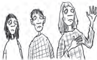
Uitgehongerde Gallische kinderen