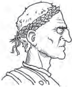
Julius Caesar, onze grote leider