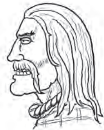
Vercingetorix, de leider van de Galliërs