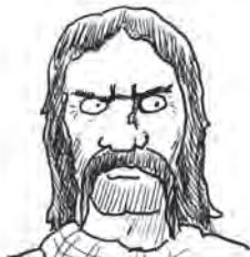
Commius, Galliër en voormalige vriend van Caesar