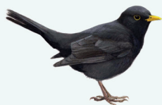
MEREL P. 24

De tuin is zonder twijfel de ideale plek om met het oefenen van de vogelzang te beginnen. De tuinvogels zijn niet schuw, zingen op korte afstand liedjes die goed van elkaar zijn te onderscheiden en laten zich vaak horen. Veel tuinvogels kom je ook in het park en het bos tegen (zie blz. 29 en blz. 47).