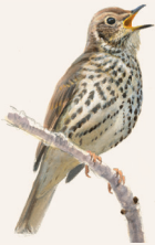
ZANGLIJSTER P. 118

We hebben maar vijf vogelsoorten die erg goed zijn in het nazingen van ander-mans lied. Vogels die in Afrika overwinteren, zoals de bosrietzanger, kopiëren ook liedjes van de zangvogels daar. Meestal hebben ze wel een eigen zangpa-troon en voegen ze daar regelmatig de zang van andere vogels aan toe. Andere imitators, zoals de spreeuw, doen soms de piepende geluiden van apparaten na. Een merel in onze tuin kon zelfs mijn fluitje nadoen waarmee ik de hond riep, tot verdriet van onze huishond Mick!