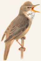
BOSRIETZANGER P. 120