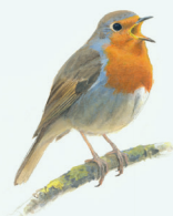
ROODBORST P. 24