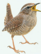
WINTERKONING P. 25