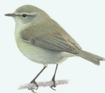
TIJFTJAF P. 27