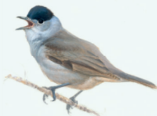
ZWARTKOP P. 26