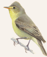
SPOTVOGEL P. 119