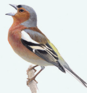
VINK P. 25