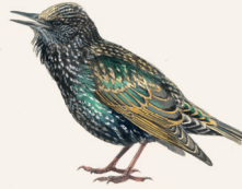
SPREEUW P. 119