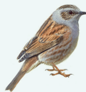
HEGGENMUS P. 27