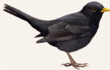
MEREL P. 118