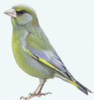
GROENLING P. 26