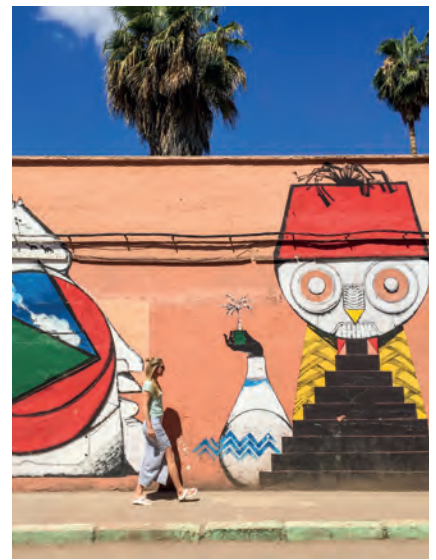
Kleurrijke street art

Palmeraie. Een bos met duizenden palm- en olijfbomen. Je kunt er op de fiets naartoe – als je durft – of je door een taxi laten afzetten voor een wandeling. Voor het échte Oosterse gevoel maak je een tocht op de rug van een kameel. Het palmbomenwoud is echter helaas niet meer ongerept, je vindt er zeker ook luxe hotels en villa's.