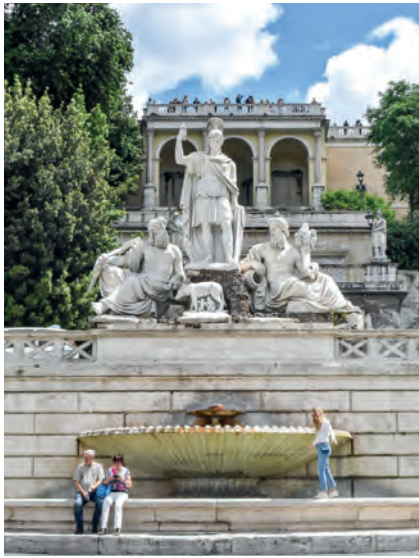
Piazza del Popolo