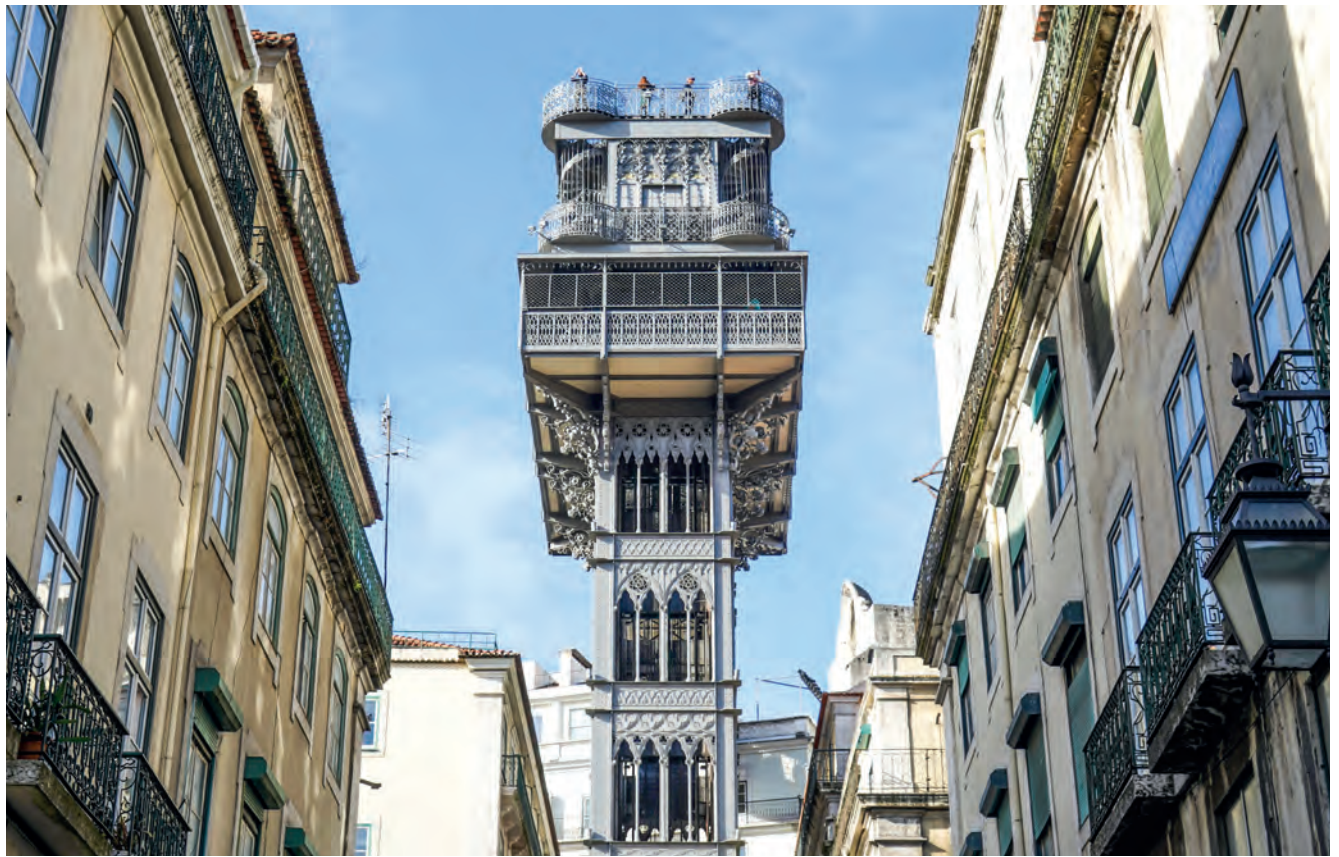
Elevador de Santa Justa