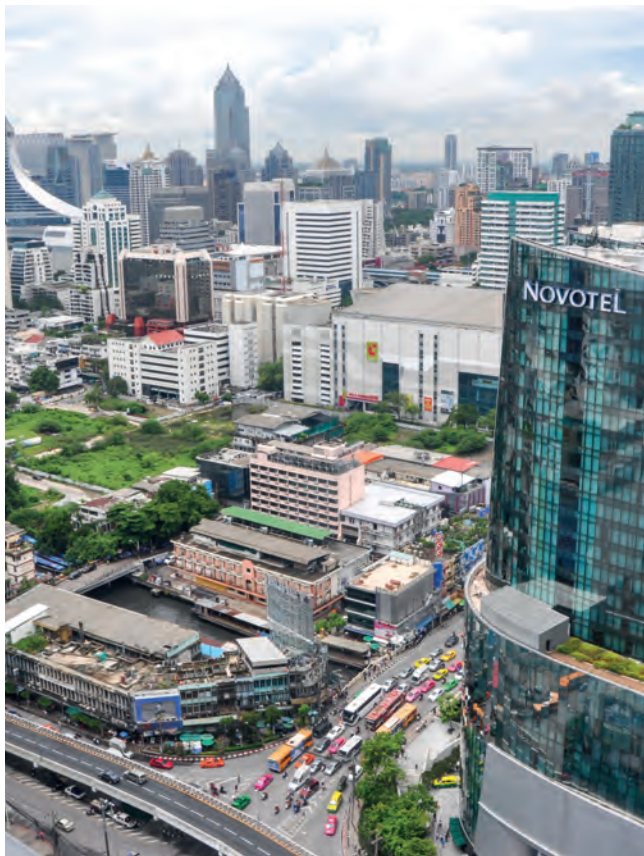
Skyline van Bangkok