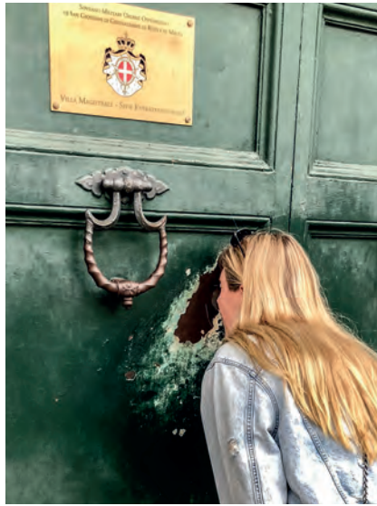
Een geheim doorkijkje