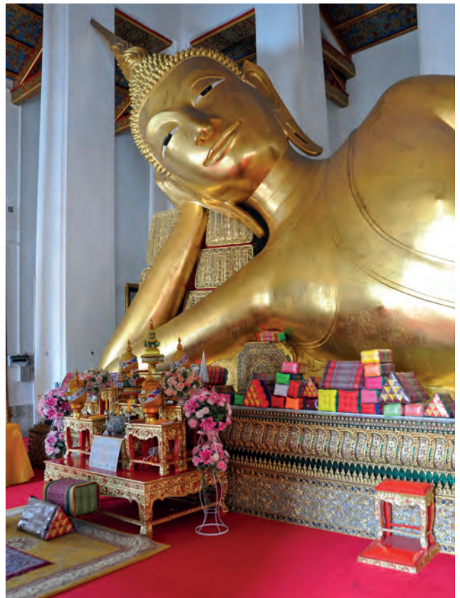
Eén van de duizenden boeddha's van Bangkok

stille kunt genieten, meditatie is namelijk hét middel van boeddhisten om mentale vrede te bereiken. Met zoveel tempels in Bangkok is het misschien lastig om te kiezen, maar Wat Ratcha o-rot is een aanrader. Je vindt deze tempel op een prachtige rustige plek, midden in een normale woonwijk en dus zie je ook meteen hoe de mensen in Bangkok écht wonen.