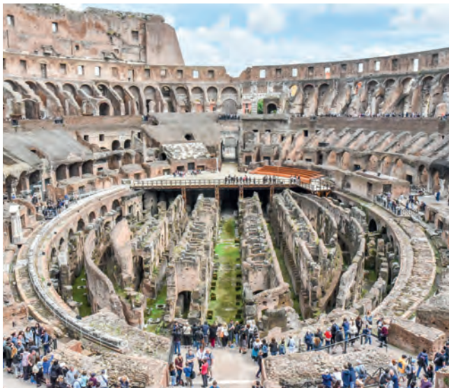
Het oude amfitheater is een must-see