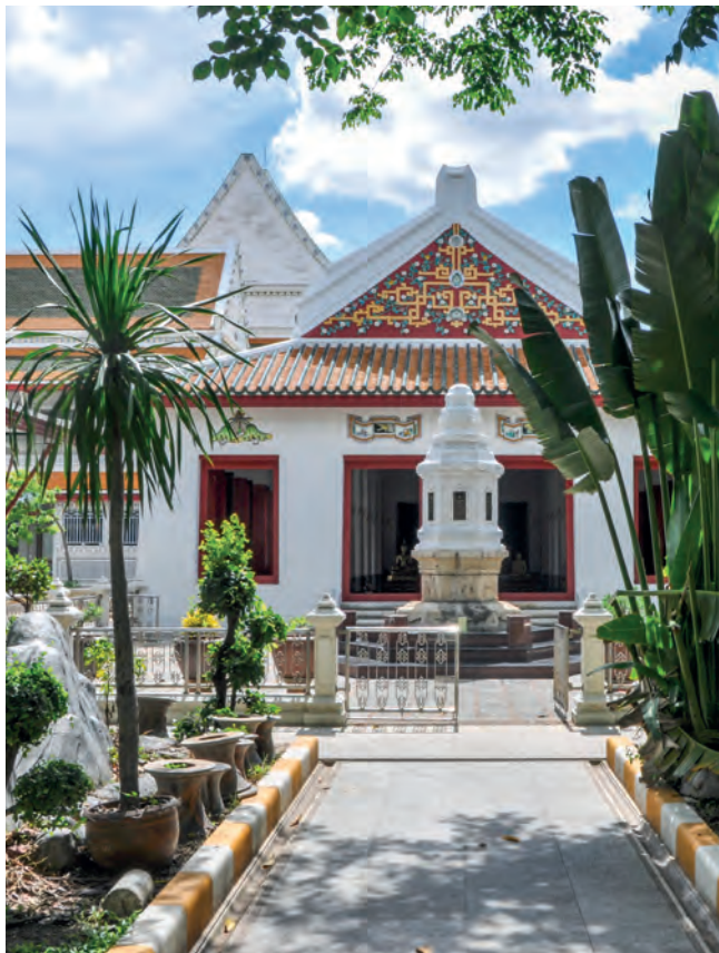
Wat Ratcha o-rot