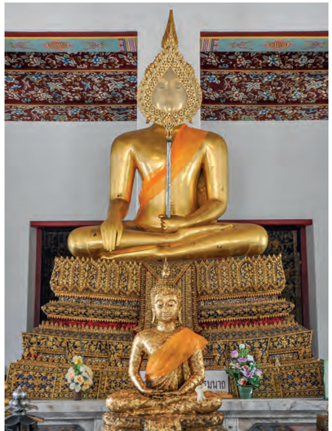
Het boeddhisme speelt een grote rol