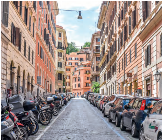
Slenteren door Trastevere