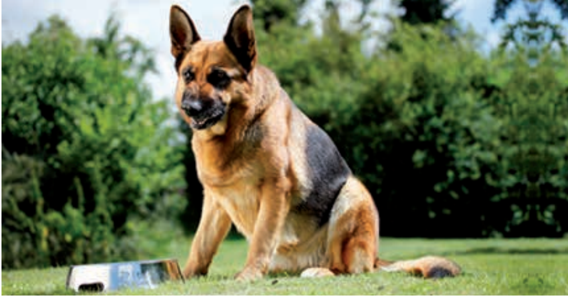
Baknijd is voor de eigenaar misschien probleemgedrag, maar niet voor de hond!

De kern van deze nieuwe benadering is het toegenomen besef dat het dier een individu met emoties is, en het gegeven dat de gedragsdeskundige steeds beter de gevoelens van het dier heeft leren interpreteren. Voor sommigen is dit idee gevaarlijk controversieel en antropomorf, alsof je menselijke eigenschappen aan dieren toekent, en omdat er geen wetenschappelijke technieken zijn om de emotionele toestand van dieren te meten. Toch is het een logische ontwikkeling, gezien de uiterst emotionele aard van alle zoogdieren. Dit vormt eigenlijk de 'kunst' van een goede, empathische gedragsdeskundige, tegenover de dierentrainers die hun cliënten de les lezen over wat het dier 'heeft', dure termen gebruiken om eenvoudige dingen te beschrijven en een standaard- behandelplan bieden.