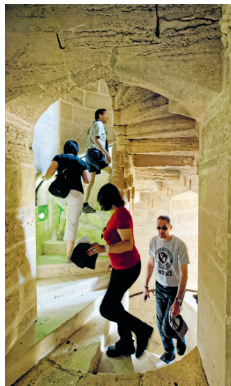
Zo'n 190 treden telt de Tour de Constance, boven word je beloofd met een prachtig uitzicht.

Begin 14e eeuw werd een machtige muur rond de belangrijke haven- en handelsstad gebouwd. Maar spoedig deed de stad van de 'dode wateren' zijn naam eer aan: het toegangskanaal naar zee verzandde en Aigues-Mortes bloedde dood. Doordat het geen strategisch belang meer had, kon het stadje de eeuwen ongeschonden doorstaan. De 32 m hoge Tour de Constance , het oudste deel van de Remparts , werd onder Lodewijk IX gebouwd. Tijdens de godsdienstoorlogen van de 17e en 18e eeuw diende de toren als staatsgevangenis. Hier begint een tour van de volledig bewaard gebleven stadsmuren met vijftien torens en tien poorten. Vanaf de weergang heb je wijds uitzicht over de omgeving en de in een schaaqbordpatroon aangelegde straten van de stad. Daar verdringen de toeristen zich voor de souvenirwinkels aan de hoofdstraat, terwijl in de zijstraatjes een bijna dorps rust heerst. Iedereen eindigt bij