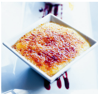
Crème catalan – regionaal patriottisme als dessert.

zondag en 's avonds is het ongebruikelijk om alleen een salade of voorgerecht te nemen.