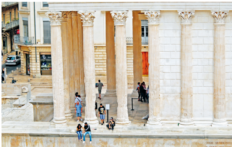
Deze 'hemelse' blik op het Maison Carrée heb je vanaf het terras van restaurant Le Ciel de Nîmes boven in het Carré d'Art.

De omgeving van het Maison Carrée werd in 1993 opnieuw vormgegeven door de beroemde Britse architect sir Norman Foster. Als pendant van de antieke tempel bedacht hij het Carré d'Art 5 (pl. de la Maison Carrée, www.carreartmusee.com, di.-zo. 10-18 uur, museum € 5, met korting € 3,70). De met licht overspoelde constructie van glas en staal herbergt naast het Musée d'Art Moderne een ultramoderne bibliotheek en mediatheek .