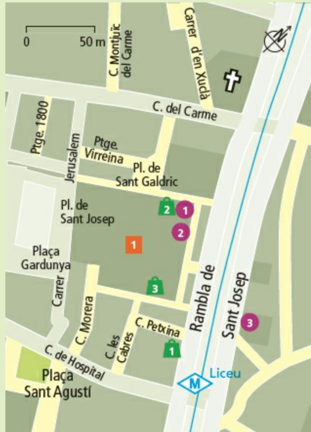
Uitneembare kaart 2 A 1/2 | Metro Liceu

p.pers.). Bij andere aanbieders kopen de cursisten samen alle ingrediënten in de Boqueria, om die vervolgens in een nabijgelegen keuken te bereiden (bijv. www.getyourguide.de , paella-workshop € 32).