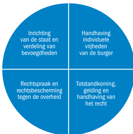
FIGUUR 1.2 Hoofdlijnen van het staatsrecht

In de volgende paragrafen beperken we ons bij de bespreking van de staat tot het grondgebied en de bevolking. De manier waarop het gezag van de staat is georganiseerd, komt in hoofdstuk 3 verder aan de orde.