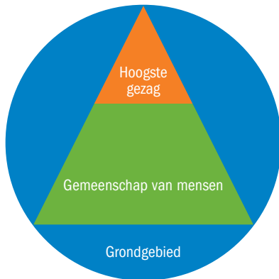
FIGUUR 1.1 Kenmerken van de staat