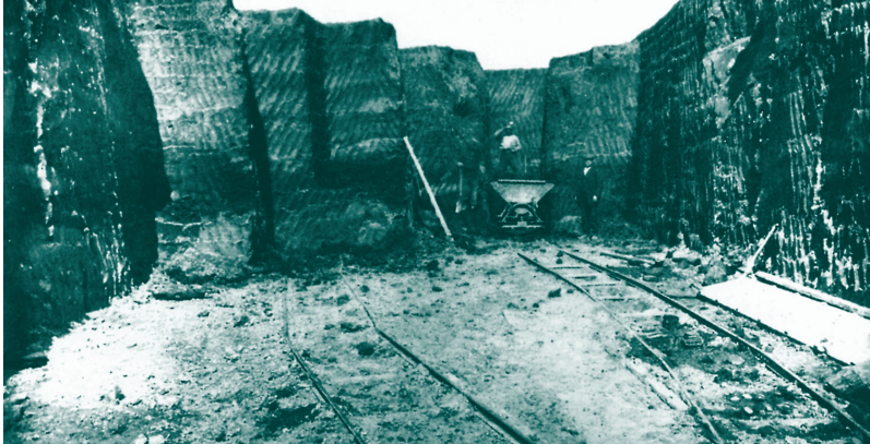
FIGUUR 0.3 Afgraving van de terp van Eenum in 1916

Het bodemarchief wordt voortdurend bedreigd door uitbreidingsplannen, wegeaanleg en dergelijke. Op die manier wordt het eigen verleden vernietigd en zijn er steeds noodopgravingen nodig in een poging te redden wat er te redden valt. In de tweede helft van de twintigste eeuw is in Nederland een derde deel van het bodemarchief verdwenen.