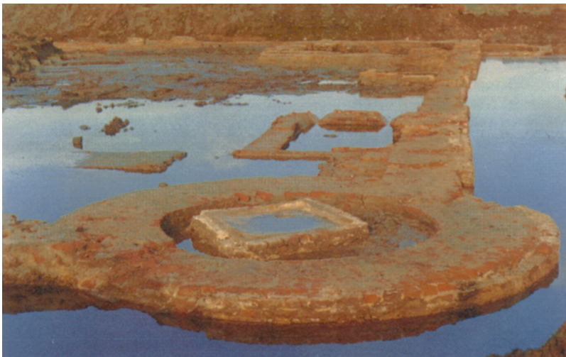
FIGUUR 0.1 Sporen in het bodemarchief: de fundamenten van het kasteel West-Souburg

De schriftelijke bronnen worden bewaard in archieven: landelijk in het Nationaal Archief in 's-Gravenhage, provinciaal in de rijksarchieven in de provinciehoofdsteden, op veel plaatsen al met stedelijke archieven gecombineerd tot Regionale Historische Centra. Daarnaast zijn er speciale archieven, zoals de kerkelijke archieven en de waterschapsarchieven.