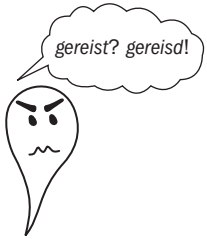
TABEL 1.12 Zwakke werkwoorden en hun voltooid deelwoord

We geven in tabel 1.12 eerst een paar voorbeelden van zwakke werkwoorden met hun voltooid deelwoord.