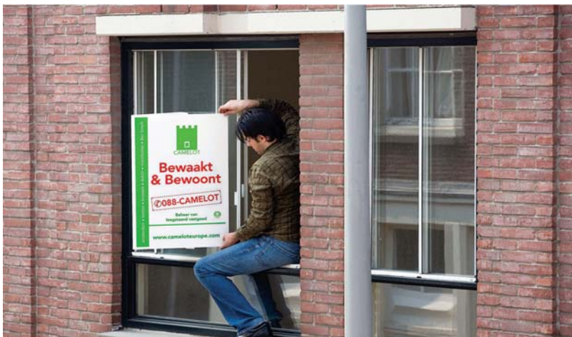
Affiche aan raam

[2a] X Het gebeurd wel vaker dat internet eruit ligt.