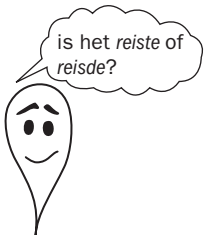
TABEL 1.3 Zwakke werkwoorden in de verleden tijd: uitgang -de(n) of -te(n)

Zwakke werkwoorden krijgen in de verleden tijd de uitgang -de(n) of -te(n). En daarmee hebben we meteen het grootste probleem te pakken: wanneer kies je de ene en wanneer de andere uitgang? Vergelijk de voorbeelden in tabel 1.3.