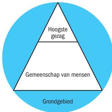
FIGUUR 1.1 Kenmerken van de staat

belangen met elkaar in evenwicht te brengen, is een zekere ordening van de samenleving nodig. We spreken van een staat als er een gemeenschap is van mensen op een bepaald grondgebied, waarover een organisatie het hoogste gezag uitoefent. De drie elementen grondgebied, gemeenschap en gezag zijn in figuur 1.1 schematisch weergegeven.