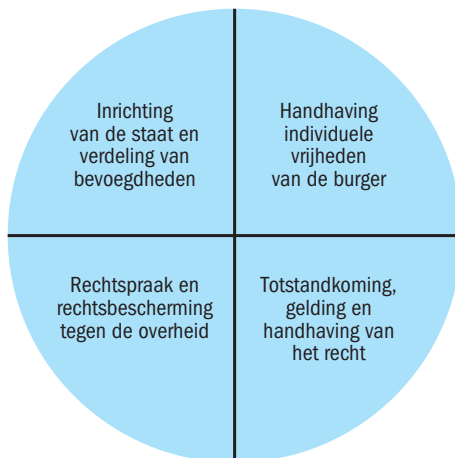
FIGUUR 1.2 Hoofdlijnen van het staatsrecht

In de volgende paragrafen beperken we ons bij de bespreking van de staat tot het grondgebied en de bevolking. De manier waarop het gezag van de staat is georganiseerd, komt in hoofdstuk 3 verder aan de orde.