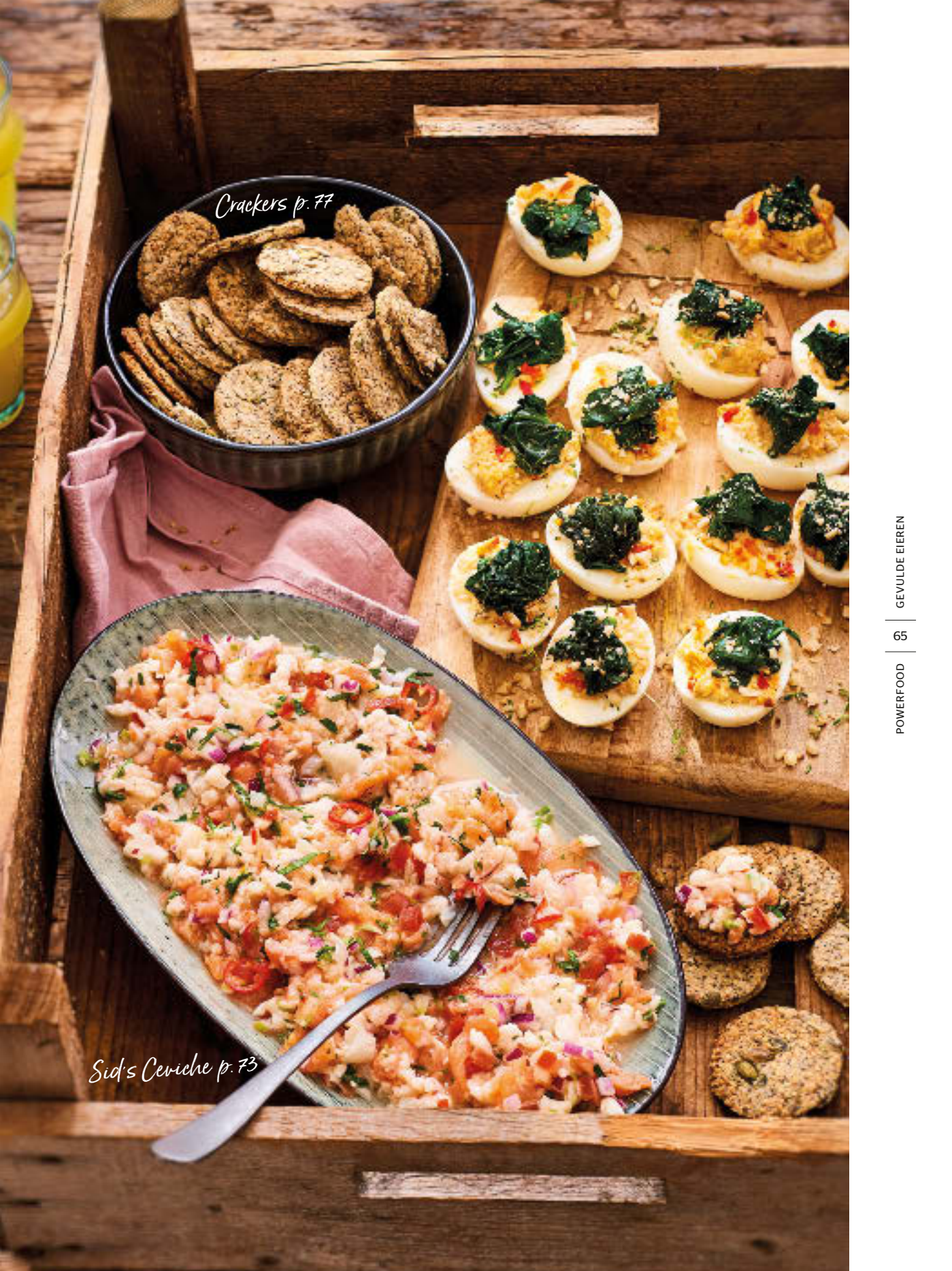
Crackers p. 77